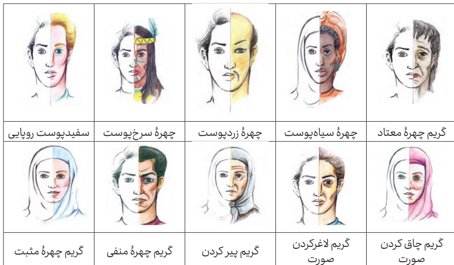
تصویر ۴. جدول گریم نژادها و چهره‌های مختلف.

سن شخصیت‌های نمایشنامه باید در نظر گرفته شود، شخصیت اخلاقی و درونی هر یک از آنان باید به گونه‌ای باشد که خصوصیات درونی شخصیتی که بازیگر در نقش آن ظاهر می‌شود، به بهترین شکل نمایان شود. اگر در نمایش به کلاه‌گیس، ریش و سبیل، تکه‌سازی و صورتک نیاز باشد، باید این وسایل از پیش تهیه و آماده شوند. چند شب قبل از اجرای نمایشنامه، اجرای گریم چهره‌ها باید انجام شود تا گریمور (چهره‌پرداز) با خطوط و حجم‌های چهره بازیگر آشنا شود و بازیگر نیز به گریم چهره خود عادت کند، به ویژه برای گریم‌های سنگین و صورتک، باید بارها تمرین شود (مرتضوی، ۱۴۰۲).