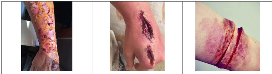
تصویر ۵. جدول گریم سوختگی، بریدگی.

در مواردی که نیاز به بدل بازیگر اصلی داریم، بدل نیز باید تا حدودی به بازیگر اصلی از نظر فرم و اندازه‌ها شبیه شخصیت