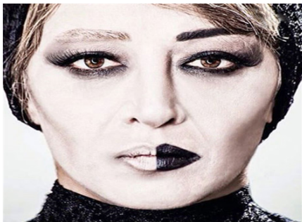
تصویر ۲. تکنیک سایه روشن.

در گریم تئاتر، توجه به فاصله بازیگر از تماشاگر بسیار مهم است. در نمایش‌هایی که در سالن‌های بزرگ برگزار می‌شوند و فاصله بین بازیگر و تماشاگران زیاد است، گریم به شکل غلیظتری انجام می‌شود. در این موارد، سایه‌ها به شکل تیره‌تر و روشنی‌ها به شکل بیشتر از معمول به کار می‌رود. در سالن‌های کوچک‌تر که فاصله تماشاگر به بازیگر کمتر است، گریم با ضخامت کمتری اجرا می‌شود. در این موارد، از رنگ‌های طبیعی‌تر و سایه‌های روشن‌تر از معمول استفاده می‌شود. در سالن‌های بزرگ، خطوط و حجم‌های اصلی چهره به نمایش گذاشته می‌شود، در سالن‌های کوچک، علاوه بر خطوط و حجم‌های اصلی، خطوط ریز نیز مورد توجه قرار می‌گیرند. در انتها، توانایی دیده شدن یک بازیگر توسط تماشاگران تأثیراتی از جمله فاصله بین بازیگر و تماشاگران و میزان نور موجود را بر اساس نیاز به تغییرات در گریم تعیین می‌کند. «فاصله بازیگران و تماشاگران ویژگی‌ها را غیرواضح