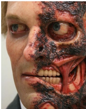
تصویر ۷. نمونه قطعه اجرا شده.

شناخت آناتومی سر، صورت و بدن در گریم با پروتز اهمیت به‌سزایی دارد. پروتز را می‌توان در بسیاری از ژانرها و سبک‌ها مانند وحشت، تخیل، فانتزی، موزیکال، سورئال و... به کار برد. گریم با پروتز، تجسم بخشیدن به قدرت تخیل ماست. که با فراهم آوردن