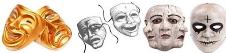
تصویر ۶. ماسک.