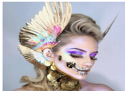
تصویر ۱. گریم فانتزی.

گریم تئاتر فرآیند تبدیل یک بازیگر به یک شخصیت با استفاده از مواد ساخته شده خاص و تکنیک‌های خاص در نمایشی است که به صحنه می‌رود (Baltacioglu, 2018). چهره‌پردازی یا گریم، حرفه‌ای است که با ایجاد تغییر پوششی موقت بر چهره و بدن بازیگر جهت دستیابی خلق شخصیت‌ها (بازیگران) در سینما، تلویزیون، تئاتر و البته عکاسی انجام می‌گیرد. گریم جهت برطرف کردن عدم هماهنگی خصوصیات جسمانی چهره و بدن بازیگر با