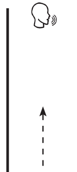
تصویر ۲. الگوی حرکتی مسیر موازی

در حرکت بعدی، کنشگران پس از برداشتن گام دیگری به سمت جلو، بدن را به سمت چپ متمایل ساخته و پس از خم شدن، کرب‌ها را در زیر زانوی چپ به هم می‌کوبند. در آخرین حرکت از یک دور کامل، پاهای خود را پس از گام برداشتن به جلو، جفت کرده به سمت بالا می‌جهند و کرب‌ها