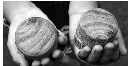
تصویر ۱. کرب، منبع: ایسکانیوز.

بیست و یکم ماه رمضان اجرا می‌گردد. عبدالله مستوفی، غروی نخجوانی و هانری ماسه ۱ خاورشناس مشهور در مکتوبات خود به این مراسم اشاره کرده‌اند. عبدالله مستوفی در کتاب خود گزارش مراسم فوق را به عهد قاجار مربوط دانسته است (مستوفی، ۱۳۹۹: ۳۹۸). این مراسم که در گذشته در بیشتر نقاط کشور و به‌ویژه در نواحی شمالی البرز رایج بود در حال حاضر با نام‌ها و شکل‌های اجرایی گوناگون- ولی با بنیانی یکسان و مشابه- در جغرافیای محدودتری به حیات خویش ادامه می‌دهد. در زفره اصفهان: جاق جاقی/ چق چقی؛ در لاهیجان: کربزنی/ کربزنی؛ در هرمزگان و استهبان فارس: چک‌چکو؛ در شهرستان سامان استان چهارمحال و بختیاری: چاق چاقو؛ در آران کاشان: سنج‌زنی؛ در سمنان و سبزوار: سنگ‌زنی و در نایین: چق چقی زدن (دریاگشت، ۱۳۷۵: ۱۱۶-۱۱۴) و (رجایی زفره‌ای، ۱۳۷۸: ۱۹۴). در روستاهای شهرستان میبد این مراسم را جغغه‌زنی می‌نامند (شعاع، ۱۳۹۳: ۷۲) و در ایبانه به آن چاق چاق‌زنی می‌گویند (نظری، ۱۳۸۴: ۵۷۹-۵۷۸).