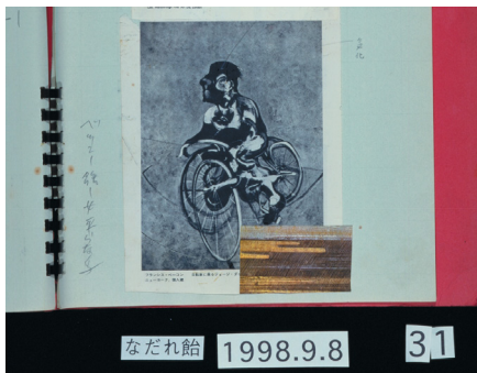
شکل ۱. بوتوفوی تاتسومی هیجیکاتا- ناداره آمه (Innami, 2021:9).

در نقاشی بیکن (شکل ۲)، تصویر جورج دایر در حالتی خلق شده که بازنمایی فیزیکی آن در واقعیت ناممکن به نظر می‌رسد. بیکن، دایر را در وضعیتی دوپاره به تصویر کشیده که هم‌زمان به دو جهت متضاد نگاه می‌کند - سر و بدنش در جهت حرکت دوچرخه قرار دارد، در حالی که بخشی از صورتش که به شکل عجیبی دفرمه شده، به سمت بیننده متمایل است. این دوگانگی در نگاه، با ساختار غیرمتعارف «چندچرخه‌ای» پنجگانه تشدید می‌شود که چرخ‌هایش بر روی خطی مورب (نمایانگر مرز