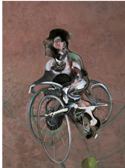
شکل ۲. پرتره جورج دایر در حال دوچرخه‌سواری اثر فرانسیس بیکن ۱۹۶۶.

در بررسی بوتوفوی هیجیکاتا، یادداشت او در کنار نقاشی بیکن جلب توجه می‌کند: «تبخیر و آب نبات - زن پرنده مسطح» (Innami, 2021:7). عبارت ژاپنی ناداره‌آمه که هیجیکاتا به کار برده، از ترکیب دو کلمه تشکیل شده: «nade» به معنای فروپاشی و «ame» به معنای آب نبات. اینامی این عبارت را نشانگر